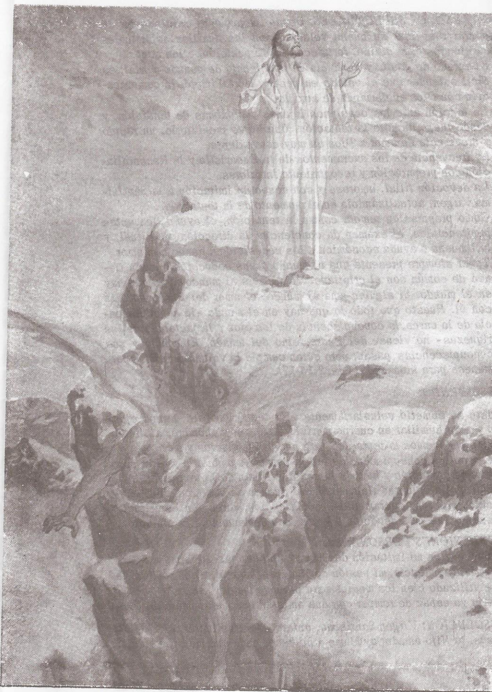
"Acabada toda tentación, el diablo se alejó de El..." (Lc. 4,13) Si permanecemos fieles en medio de la tentación, ésta, lejos de ser para nosotros un mal, nos reporta un gran bien al ser ocasión de mérito.

Evidentemente Jesús no podía caer en la tentación, pero ciertamente en su Persona la humanidad pasó por la humillación de some-